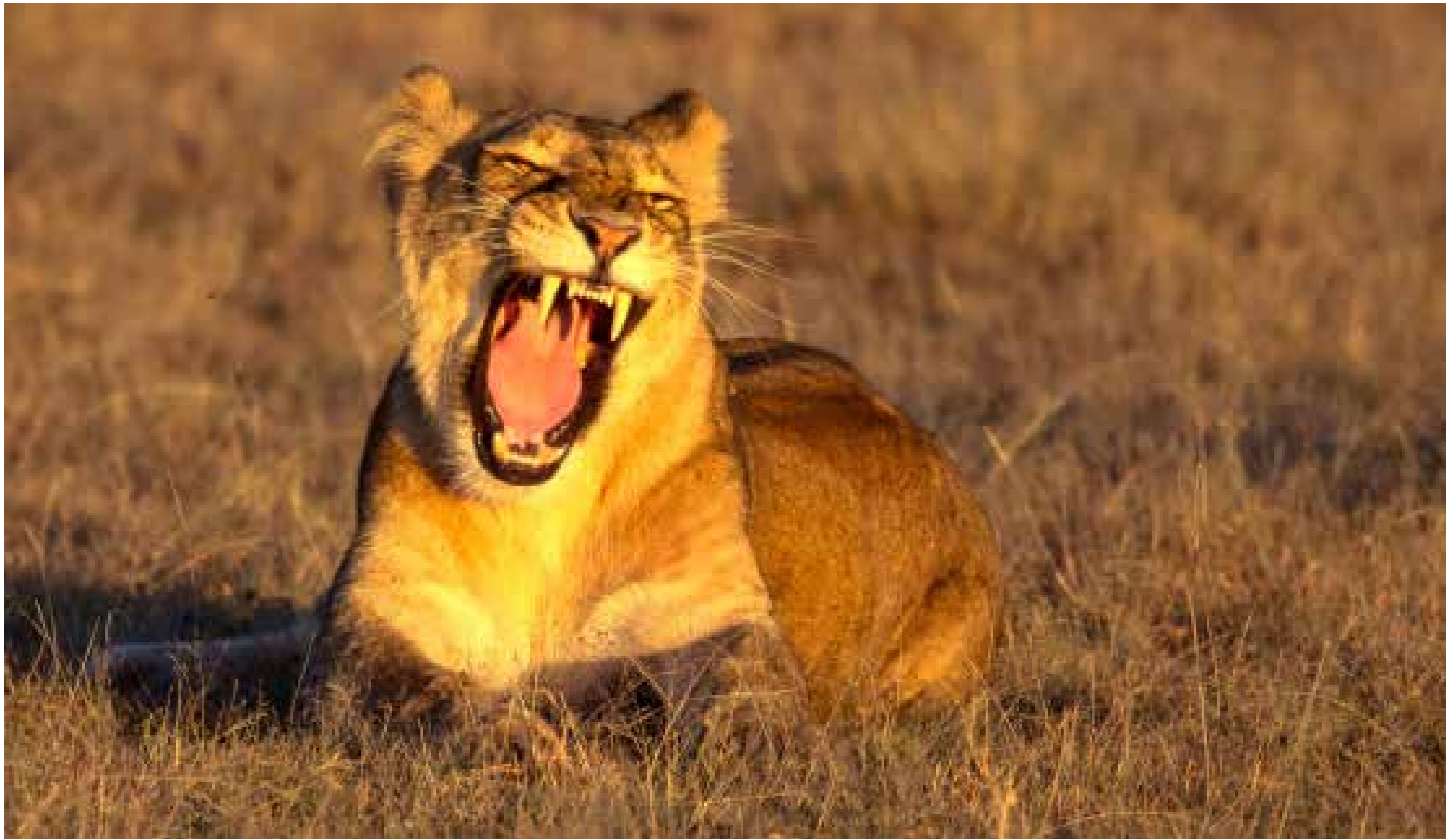
Löwin / Krüger Nationalpark / Südafrika