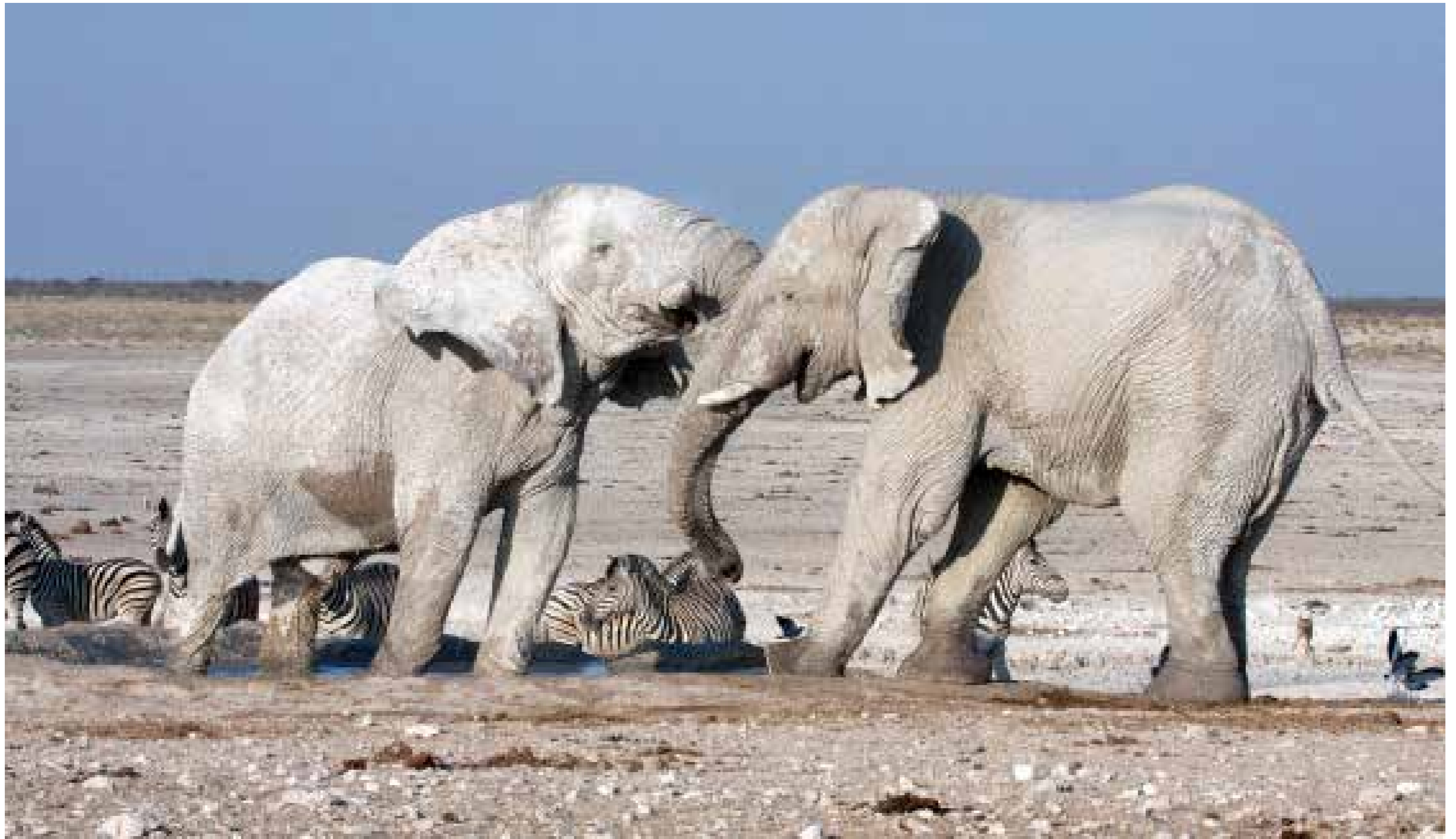
Elefantenbullen / Etosha Nationalpark / Namibia