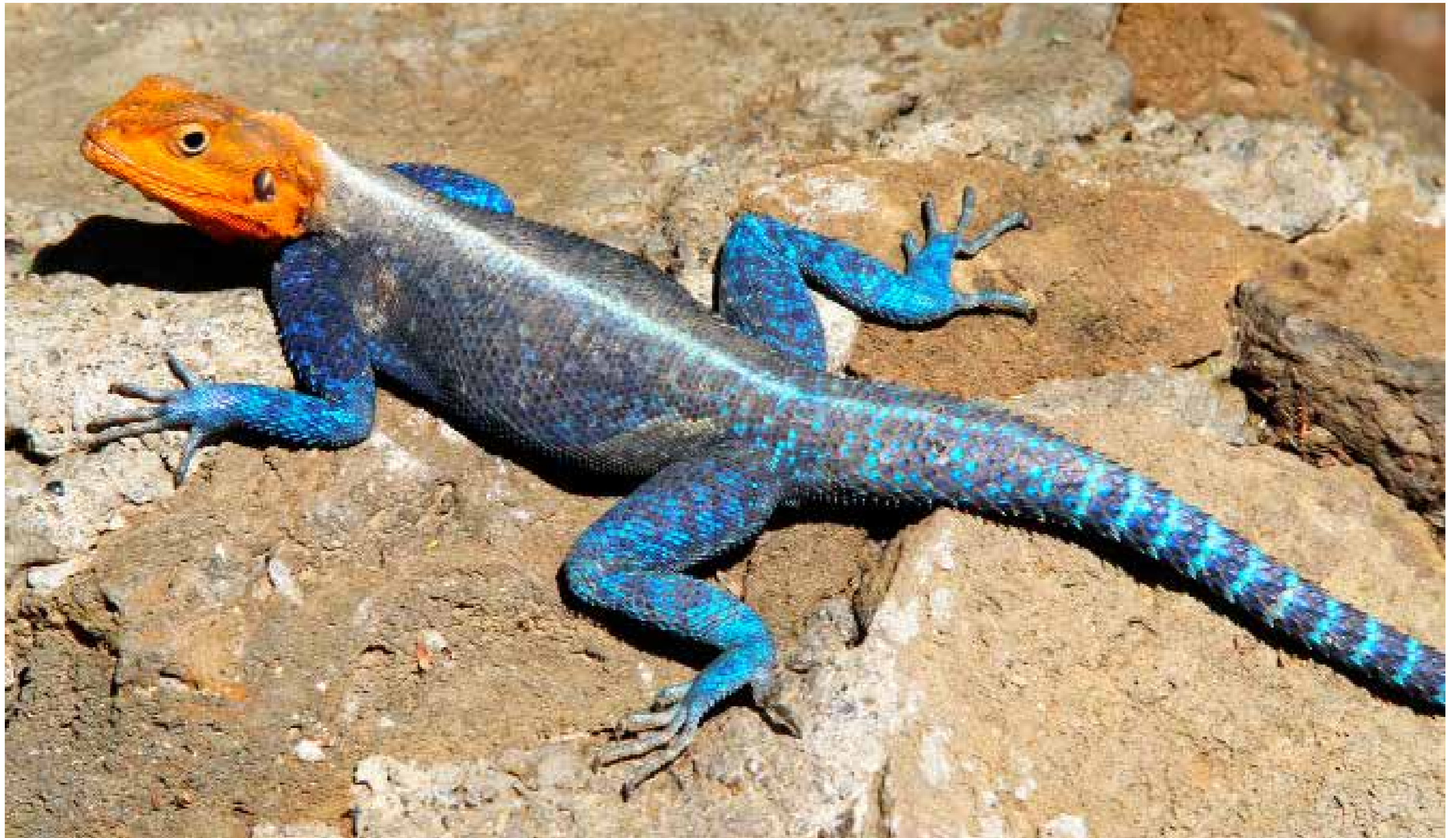
Felsagame / Brandberg / Namibia