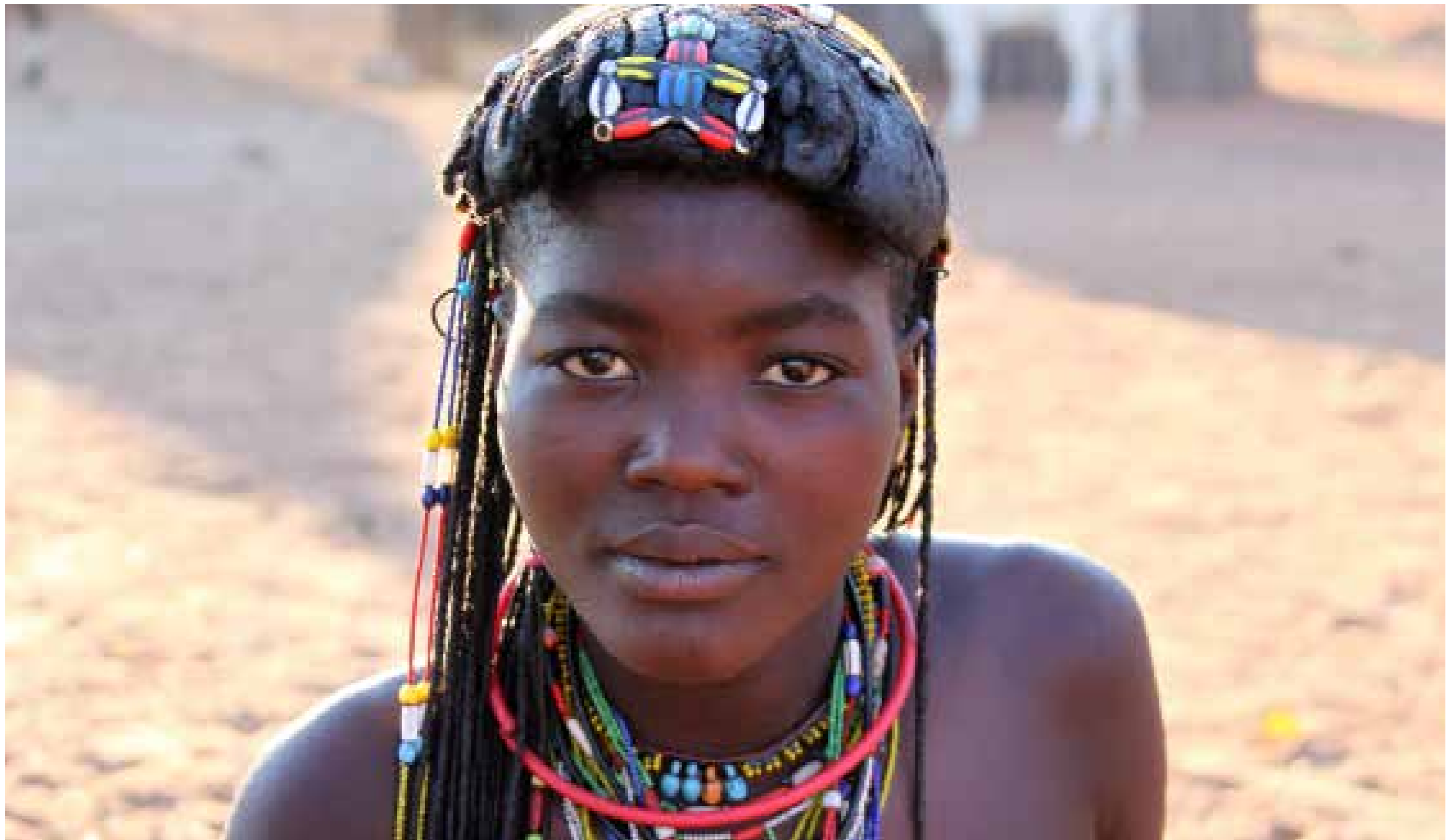
Mucahona / Kaokoveld / Namibia