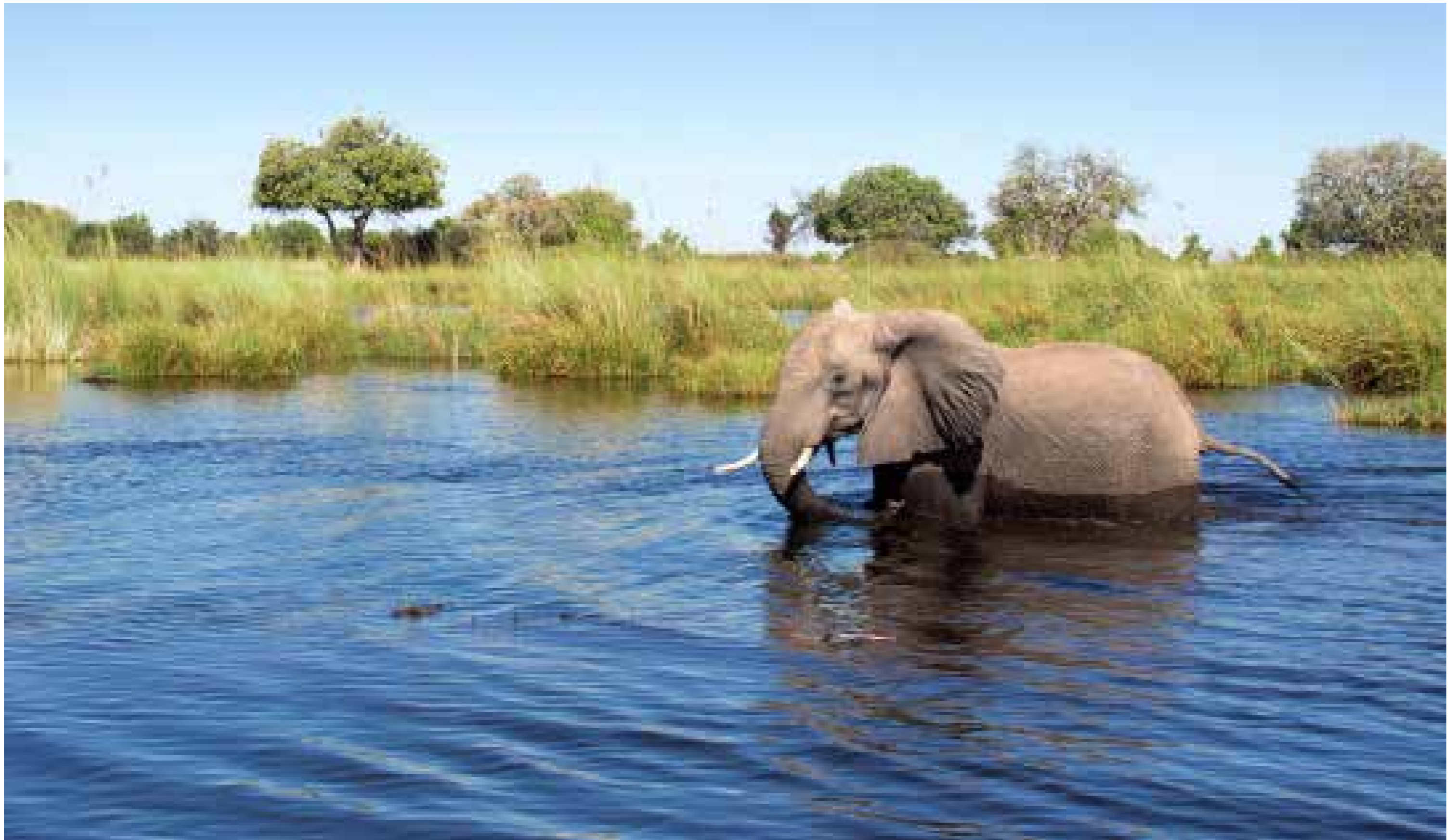
Elefantenbulle / Okavango Delta / Botswana