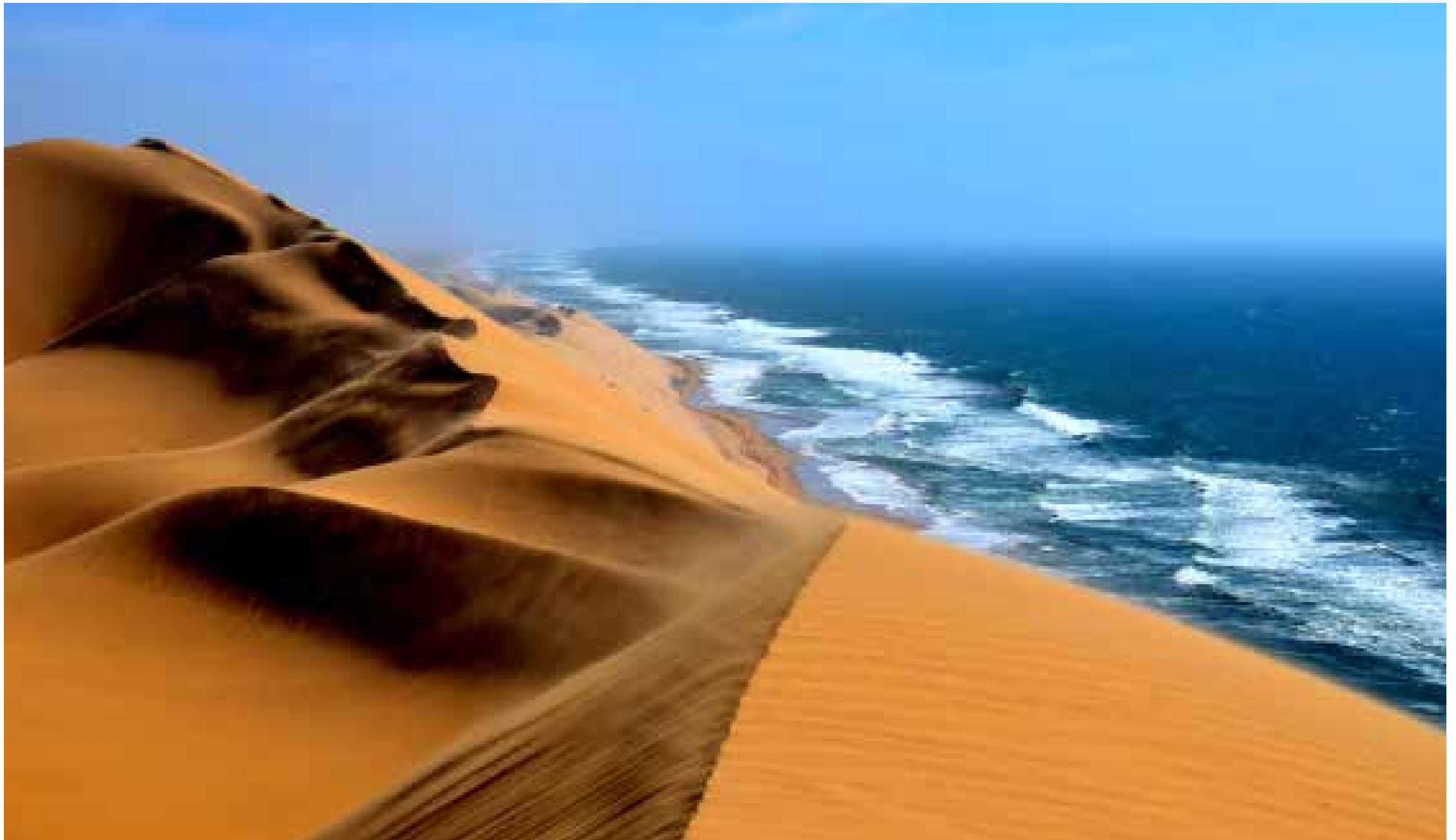
Küste bei Lüderitz / Sperrgebiet Nationalpark / Namibia