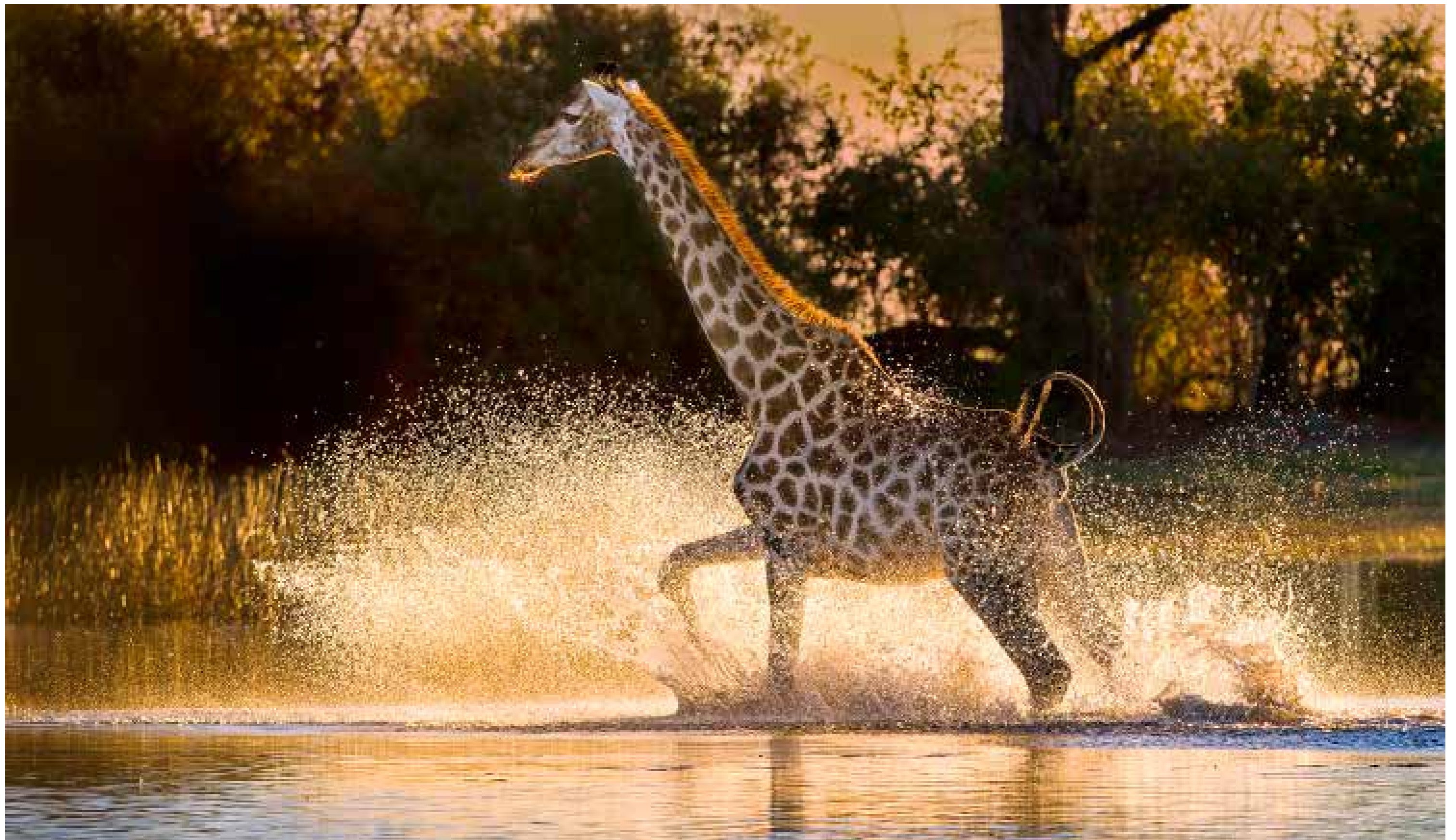
Angolagiraffe / Moremi Game Reserve / Botswana