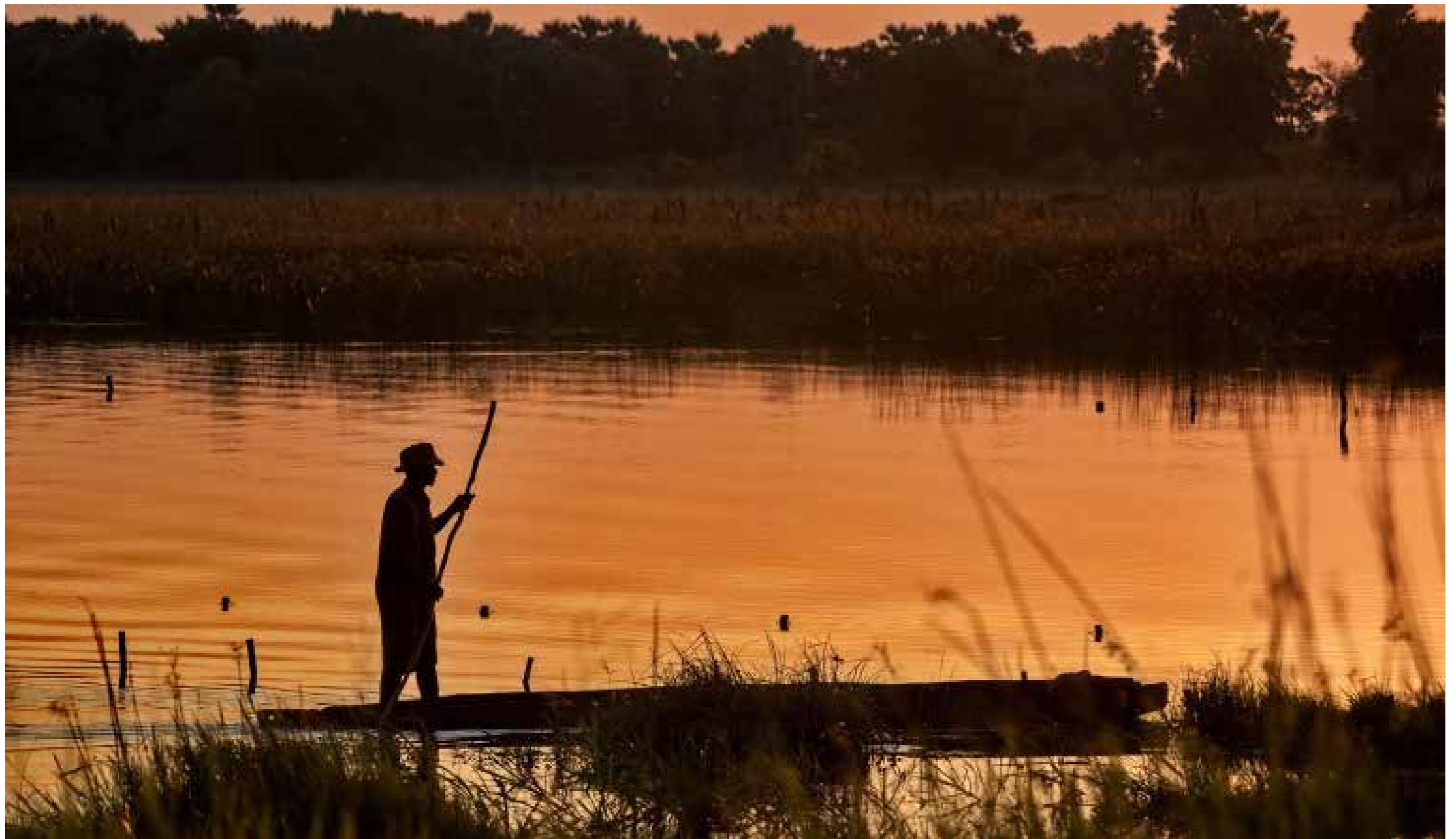
Mokoro Poler / Okavango-Delta / Botswana