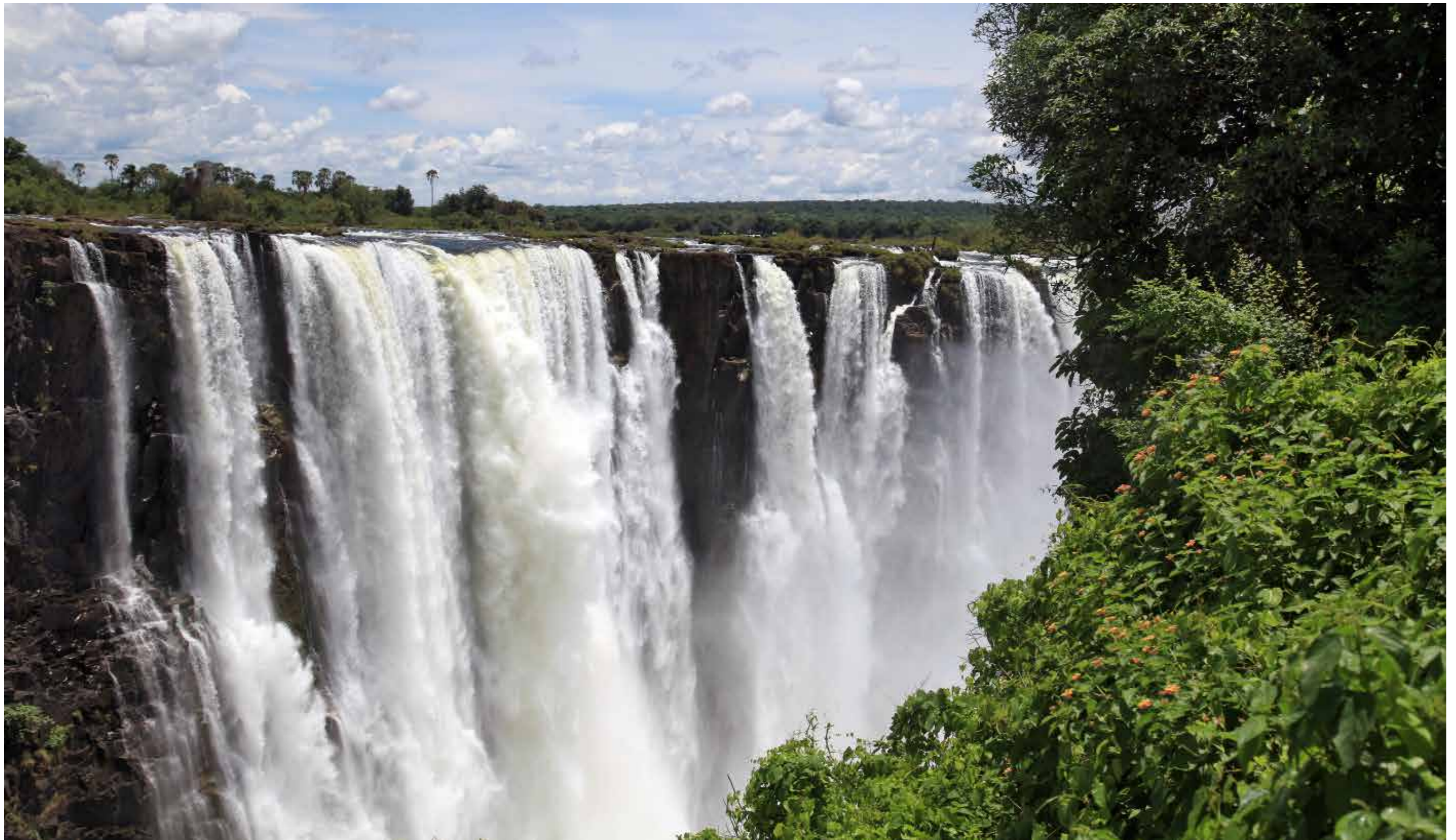
Victoriafälle / Zambezi Nationalpark / Simbabwe