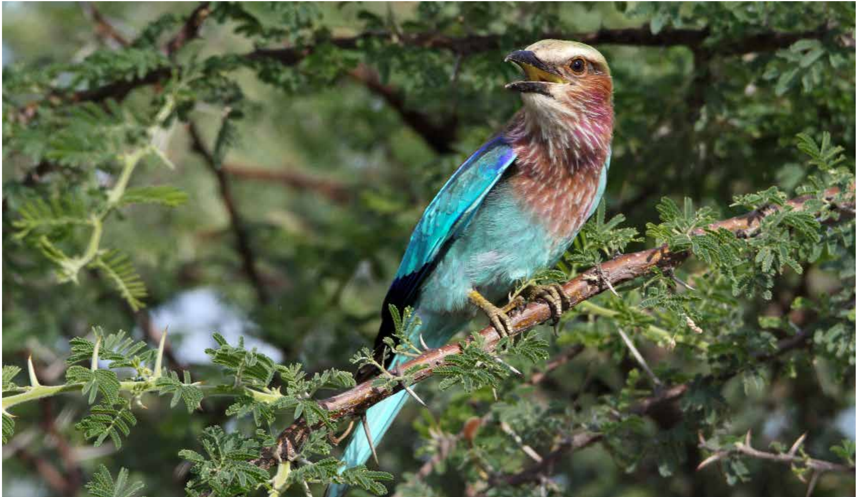
Gabelracke / Kgalagadi Transfrontier Park / Südafrika