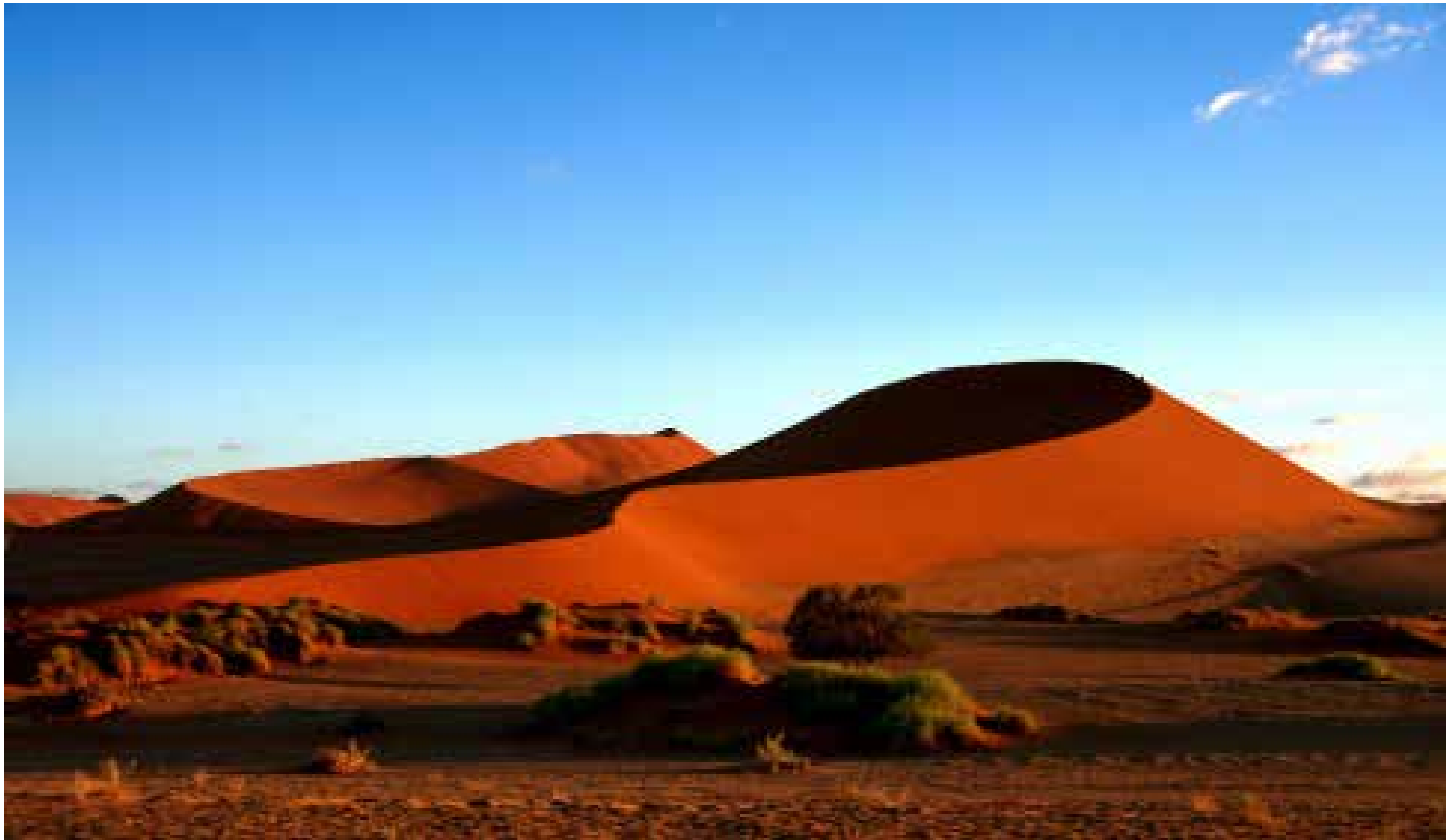
Sossusvlei / Namib-Naukluft Nationalpark / Namibia