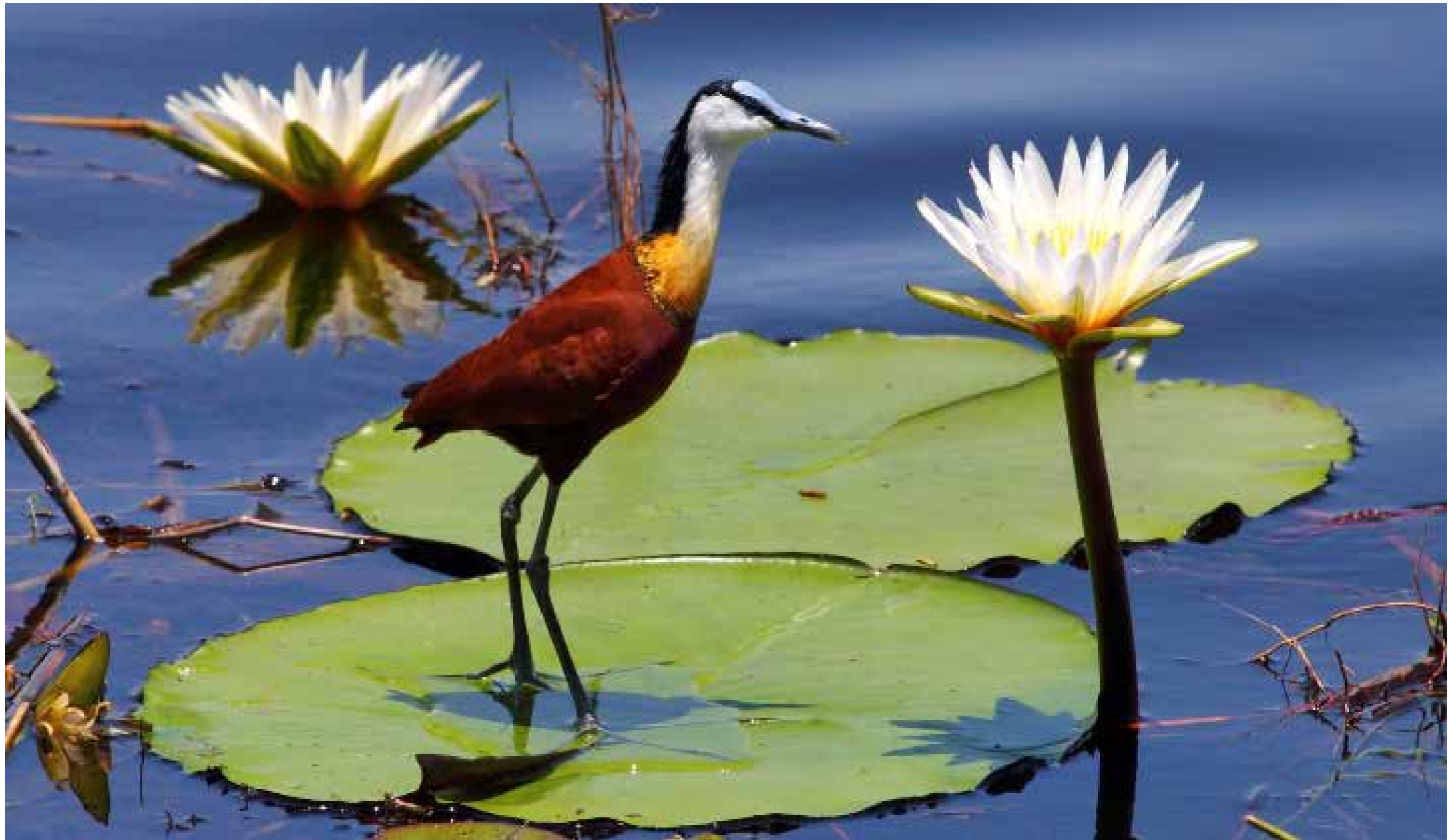
Blaustirn-Blatthühnchen / Okavango Delta / Botswana